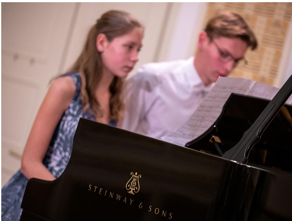
„Křest klavíru“ koncertní sál ZUŠ 30. 11. 2022 Koncertní sál ZUŠ

Školní rok 2022/2023 začal 1. 9. 2022, vyučování pak dle platných rozvrhů 5. 9. 2022