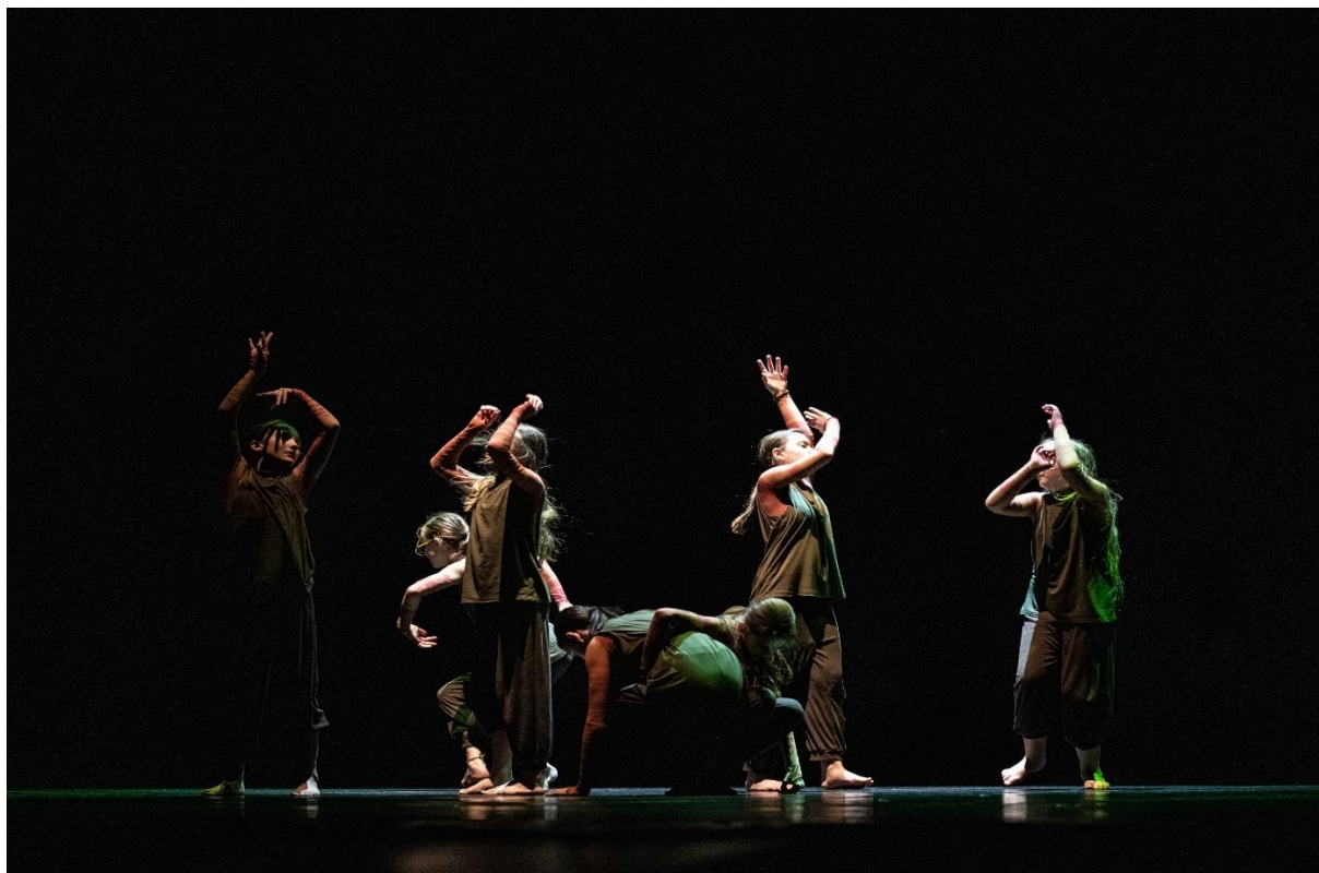
Představení TO v Horáckém divadle Malá princ