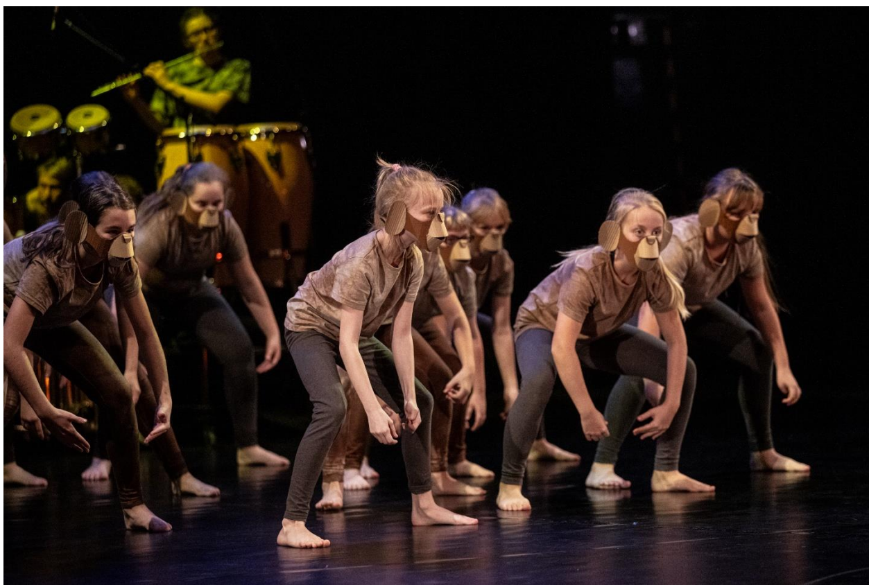
Vystoupení TO Kniha džunglí v HD 17. 12. 2023